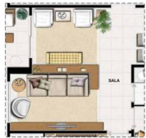
OPÇÃO SALA AMPLIADA