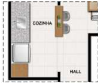
OPÇÃO COZINHA AMERICANA