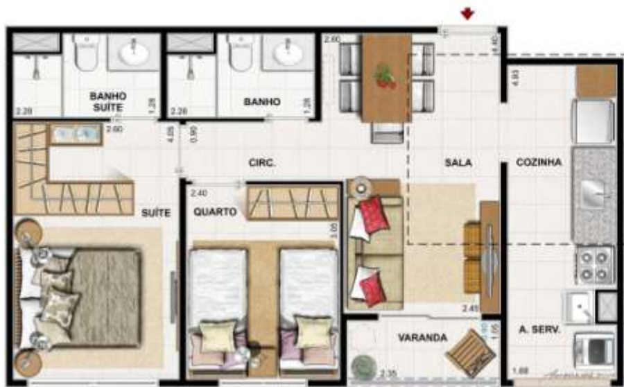
Alteração para o apartamento 101 dos blocos 1 e 3