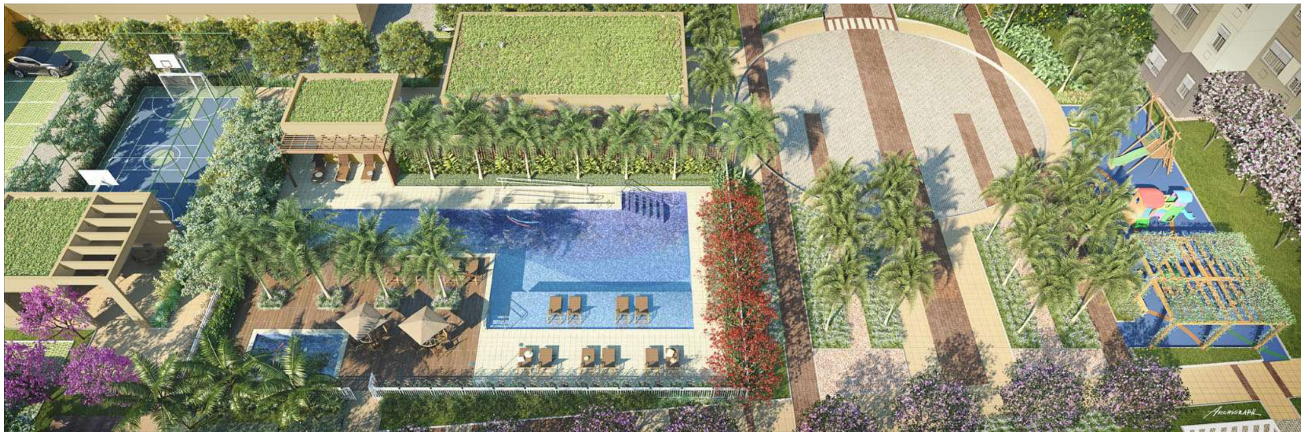
VISTA GERAL DO LAZER