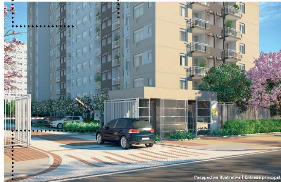
Perspectiva ilustrativa | Entrada principal

FLEXIBILIZAÇÃO DE PLANTAS E OPCIONAIS DE ACABAMENTO