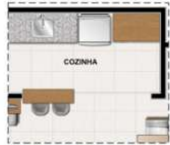
OPÇÃO COZINHA AMERICANA