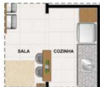
OPÇÃO COZINHA AMERICANA