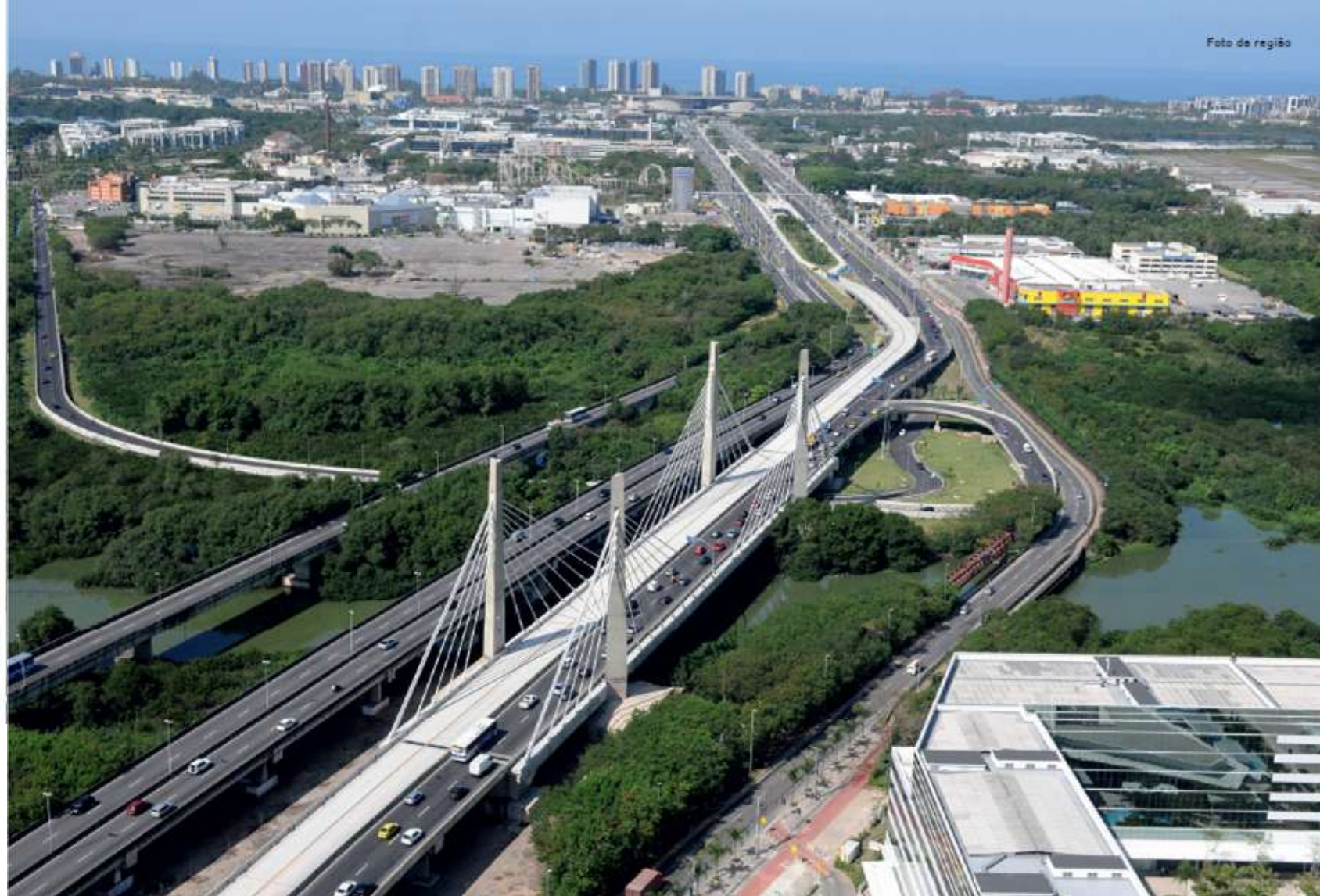
Foto da região

Sua localização privilegiada une as melhores opções de lazer ao ar livre e a praticidade de ter muitos serviços e o comércio ao lado de casa.