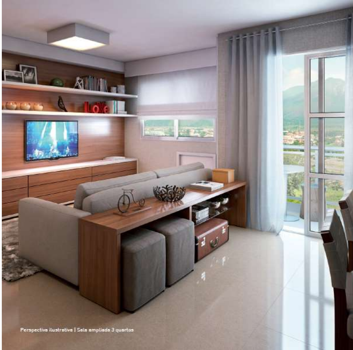
Perspectiva ilustrativa | Sala ampliada 3 quartos